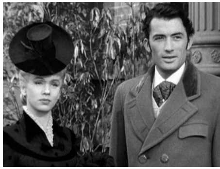
1945 LA VALLÉE DU JUGEMENT (The Valley of Decision) de John M. Stahl avec Gregory Peck