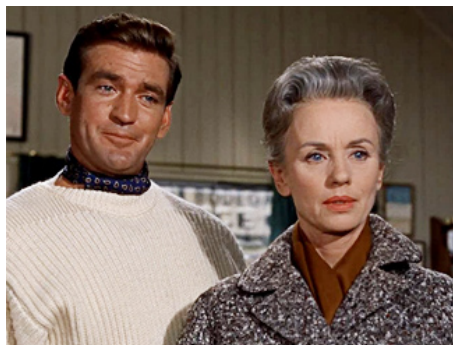
1963 LES OISEAUX (The Birds) d'Alfred Hitchcock avec Rod Taylor