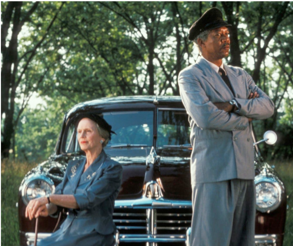
1989 MISS DAISY ET SON CHAUFFEUR (Driving Miss Daisy) de Bruce Beresford avec Morgan Freeman