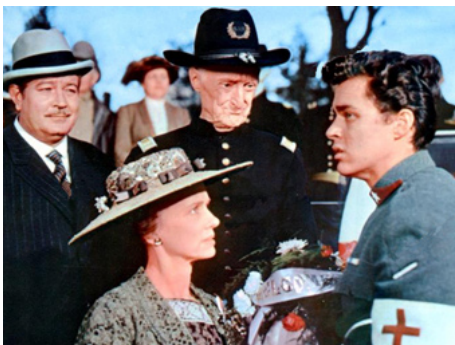
1962 AVENTURES DE JEUNESSE (Adventures of a young man) de Martin Ritt avec Richard Beymer