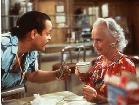
1987 MIRACLE SUR LA 8 E RUE (Batteries not included) de Matthew Robbins avec Michael Carmine