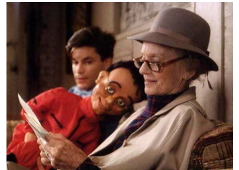
1989 LA CONTEUSE D'HISTOIRE (The Story Lady) de Larry Elikann avec Christopher Gartin