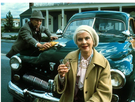
0981 HONKY TONK FREEWAY de John Schlesinger avec Hume Cronyn