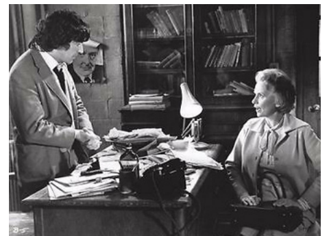
1974 BUTLEY (Butley) d'Harold Pinter avec Alan Bates