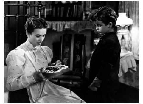
1946 LES VERTES ANNÉES (The Green Years) de Victor Saville avec Dick Stockwell