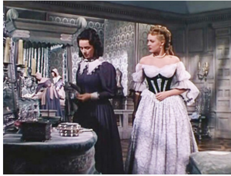
1947 AMBRE (Forever Amber) d'Otto Preminger avec Linda Darnell