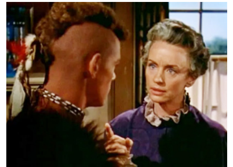
1958 UNE LUEUR DANS LA FORÊT (The Light in the Forest) d'Herschel Daugherty avec James McArthur