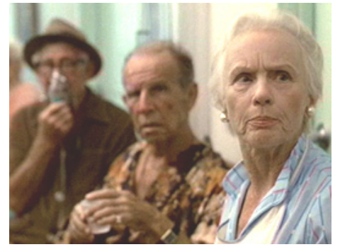
1985 COCOON (Cocoon) de Ron Howard avec Hume Cronyn