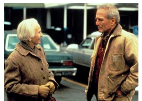
1994 UN HOMME PRESQUE PARFAIT (Nobody's Fool) de Robert Benton avec Paul Newman