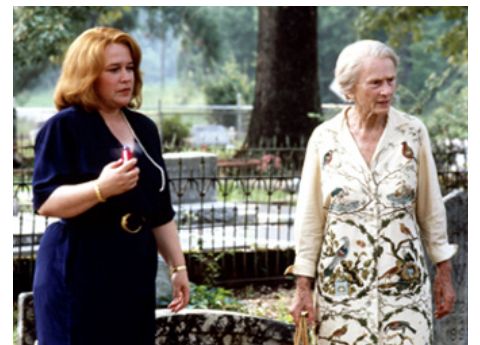
1991 BEIGNETS DE TOMATES VERTES (Fried Green Tomatoes) de Jon Avnet avec Kathy Bates