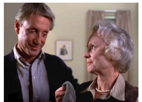
1982 LA MORT AUX ENCHÈRES (Still of the Night) de Robert Benton avec Roy Scheider