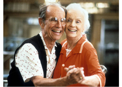
1988 COCOON, LE RETOUR (Cocoon, the Return) de Daniel Petrie avec Hume Cronyn