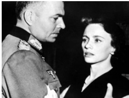
1951 LE RENARD DU DÉSERT (The Desert Fox) d'Henry Hathaway avec James Mason