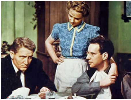
1944 LA SEPTIÈME CROIX (The 7th Cross) de Fred Zinnemann avec Spencer Tracy, Hume Cronyn