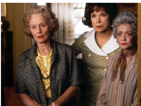
1992 QUATRE NEW-YORKAISES (Used People) de Beeban Kidron avec Sh. MacLaine, Sylvia Sidney