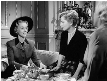
1950 LES AMANTS DE CAPRI (September Affair) de W. Dieterle avec Joan Fontaine, Françoise Rosay