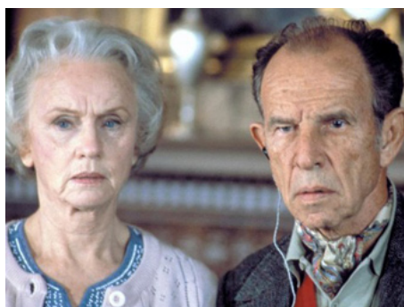
1982 LE MONDE SELON GARP (The world according to Garp) de George Roy Hill avec Hume Cronyn