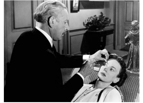
1948 VENGEANCE DE FEMME (A Woman's Vengeance) de Zoltan Korda avec Cedric Hardwicke