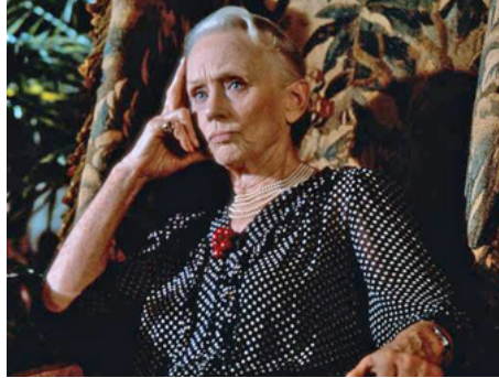
1988 UNE FEMME EN PÉRIL (The House on Carroll Street) de Peter Yates