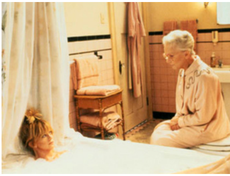
1982 LES MEILLEURS AMIS (Best Friends) de Norman Jewison avec Goldie Hawn