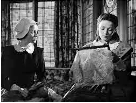
1946 LE CHÂTEAU DU DRAGON (Dragonwyck) de Joseph L. Mankiewicz avec Gene Tierney